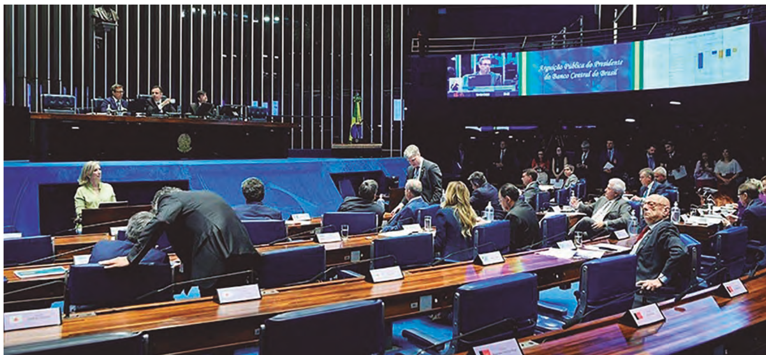
Minirreforma postergada pelo Senado revelou posições contrárias e favoráveis entre representantes dos vários segmentos da sociedade local

No texto que passou na Câmara, destacam-se alterações que proíbem candidaturas coletivas, reduzem o tempo de inelegibilidade para políticos que foram condenados, autoriza compartilhamento de campanha entre partidos distintos, instaura a obrigatoriedade do fornecimento de transporte público gratuito no