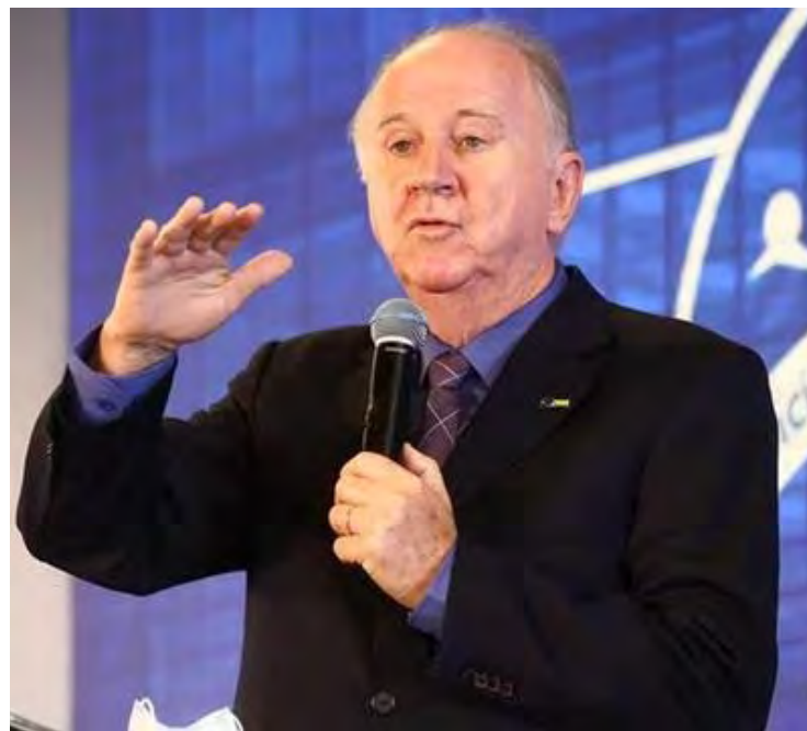
Paulo Ziulkoski: grave crise financeira das prefeituras brasileiras

2 mil prefeitos brasileiros estão em Brasília em busca de apoio do governo Lula e do Congresso para superar crise financeira