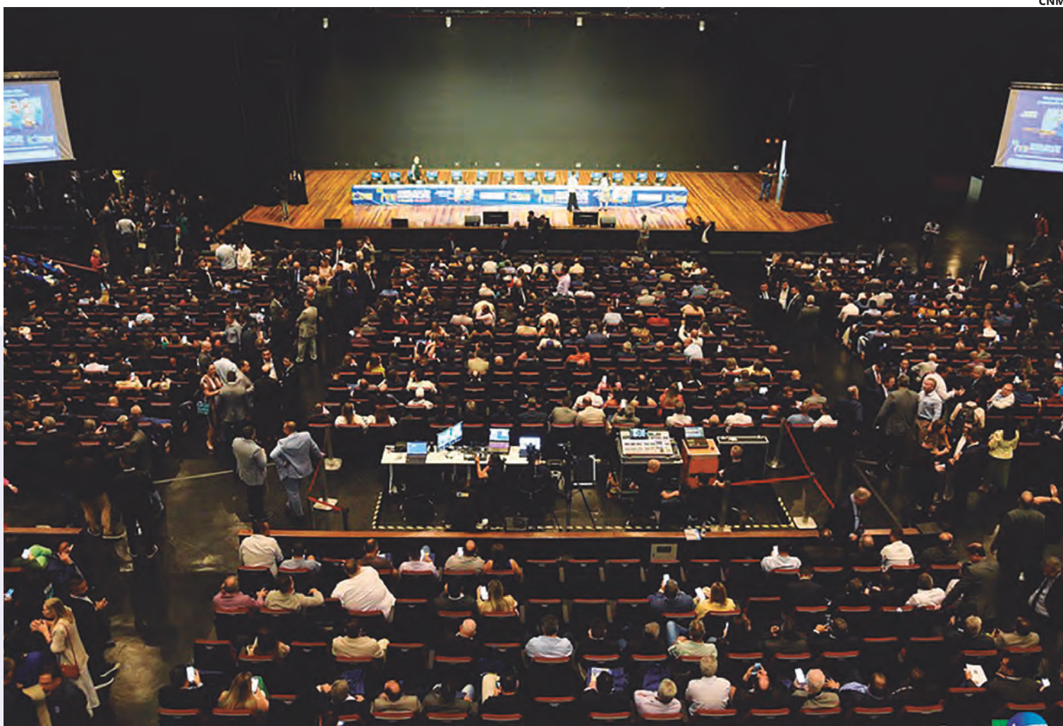
Situação dos municípios é tratada em todas as frentes; depois de movimentos em Anápolis e Goiânia, prefeitos se manifestam na capital federal

O certo é que os prefeitos, desde o início do ano, estão mobilizados nas pautas da redução de repasse de impostos federais e da discussão da Reforma Tributária.