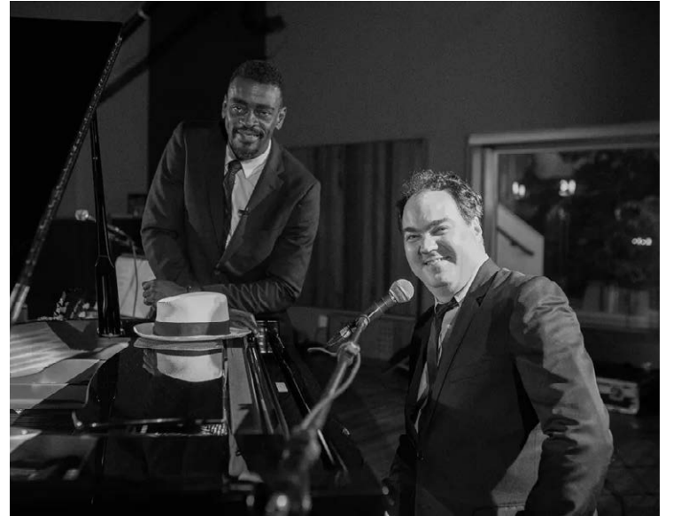
Unidos pela bossa: músicos apresentam sucessos de estilo