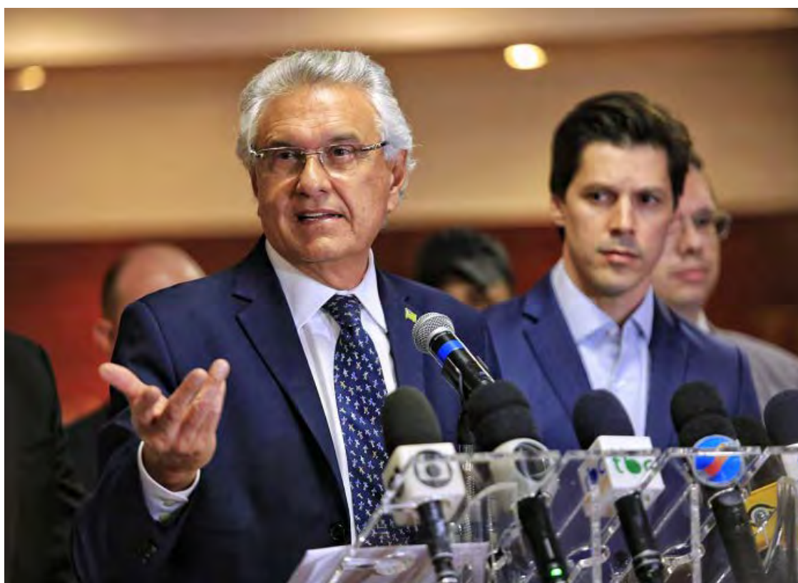
Ronaldo Caiado: sem data para discutir apoio às eleições em Goiânia

“Todos os partidos estão se mexendo e muitos colocam seus nomes, mas isso não pode