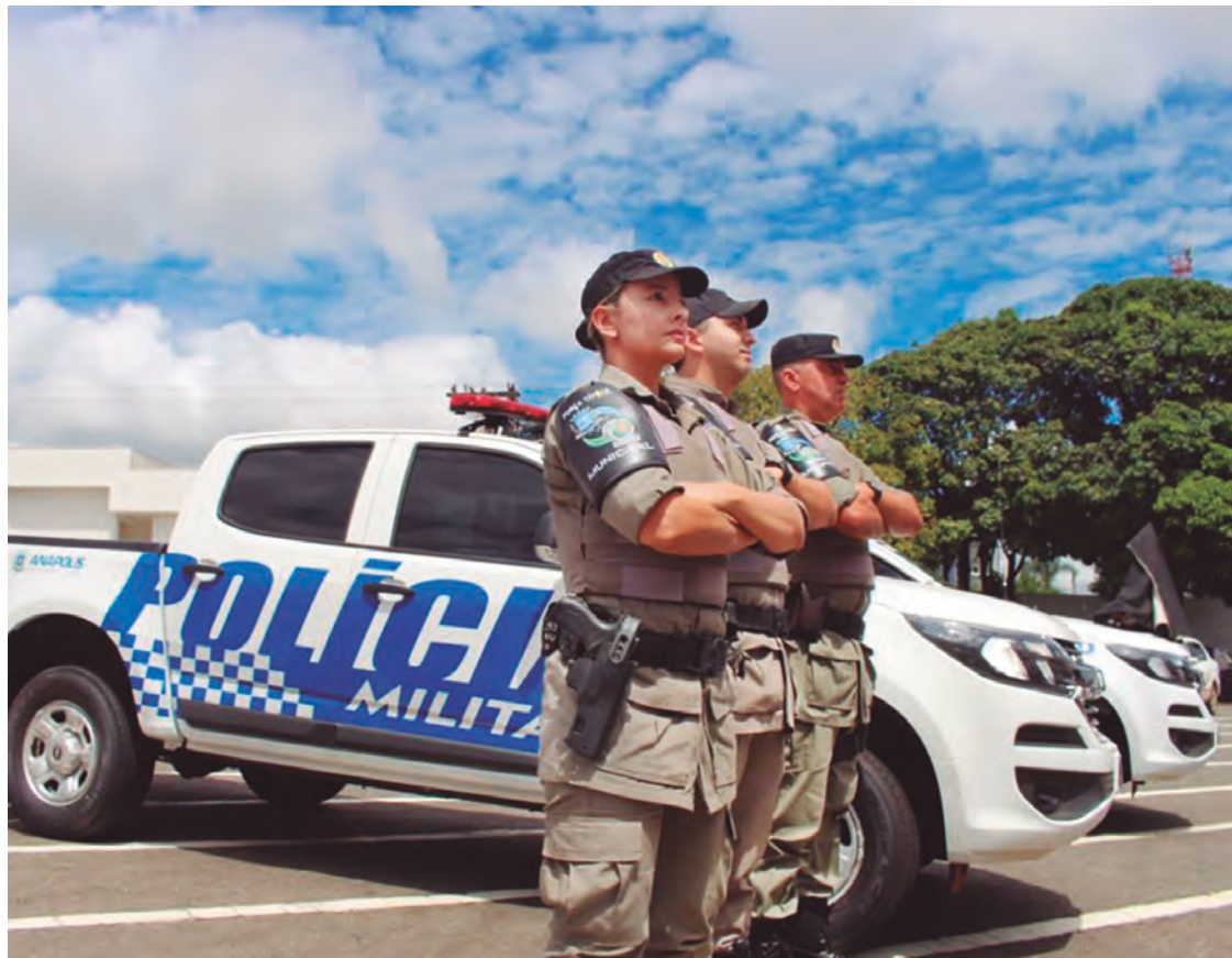
Força Tática, parceria da Polícia Militar com Prefeitura, tem papel importante no processo de diminuição de crimes

Quatro modalidades de roubo apresentaram queda entre 2022 e 2023. A maior redução foi de roubo a comércio, de 38