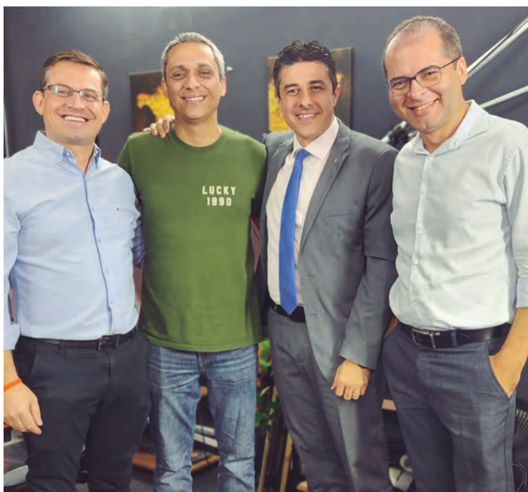
Dirigentes dos dois partidos se reuniram na capital do Estado nesta terça-feira (3) o que pode indicar o início de um processo de aliança