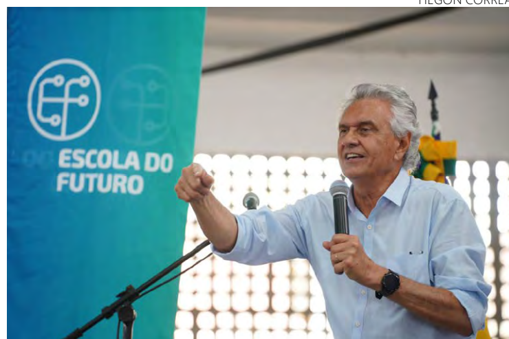
Escola do Futuro de Valparaíso de Goiás é inaugurada pelo governador Ronaldo Caiado

Já pela Agência Goiana de Habitação (Agehab), foram