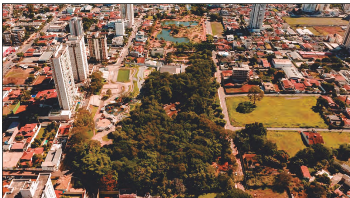
Espaço ambiental ocupa área total de 25 mil metros quadrados, e conta com investimento de R$ 1,3 milhões

A ordem de serviço para o andamento da obra foi assinada em 20 de junho deste ano. Ao DM, a gestão municipal relatou que tiveram imprevistos durante o processo, o que levou o projeto a passar por readequações em relação a acessibilidade, prolon-