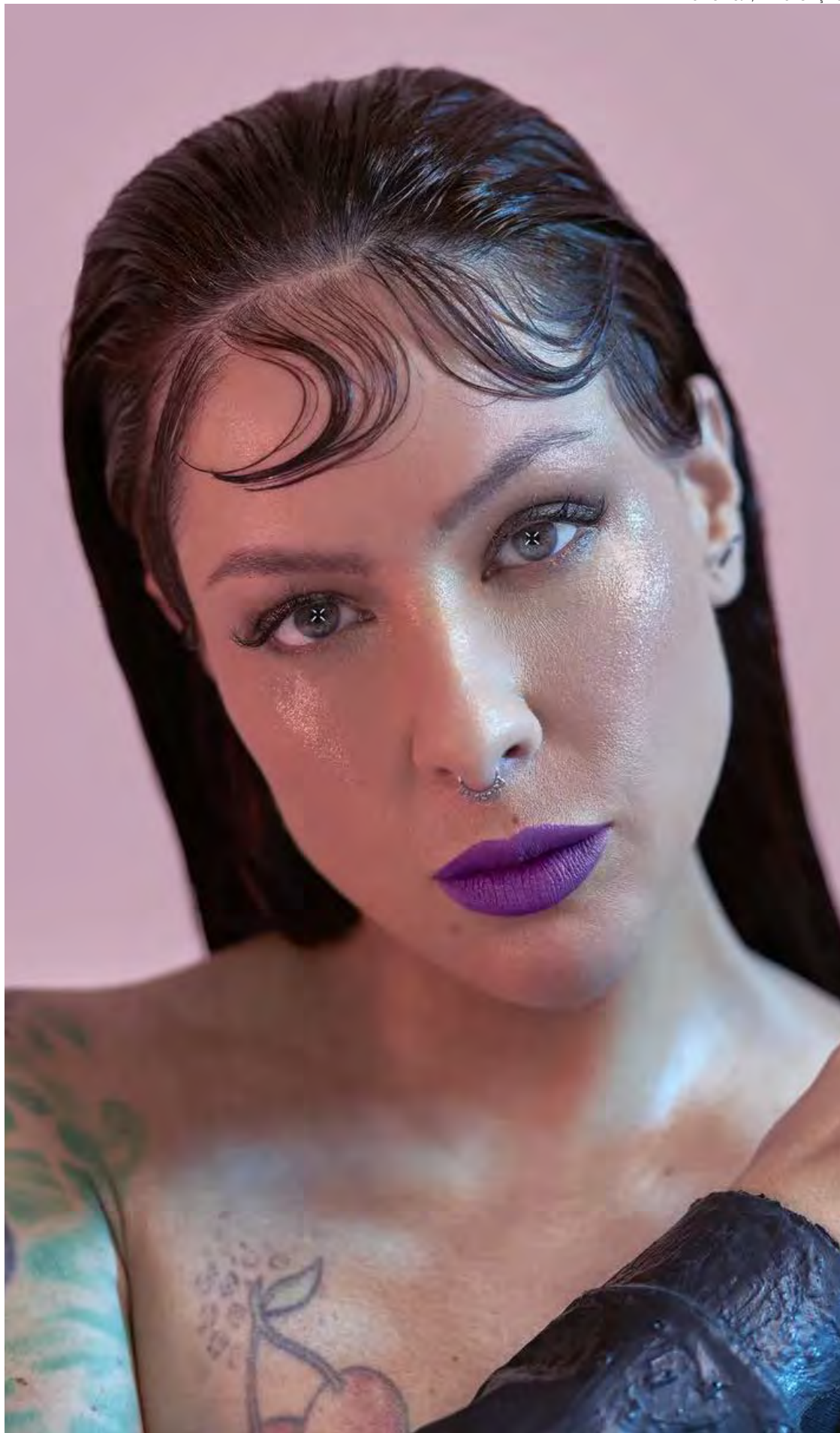
Fôlego novo: cantora colocou álbum dentre os mais importantes do rock brasileiro

Assim que "Admirável Chip Novo" saiu, em 2003, Pitty cos-