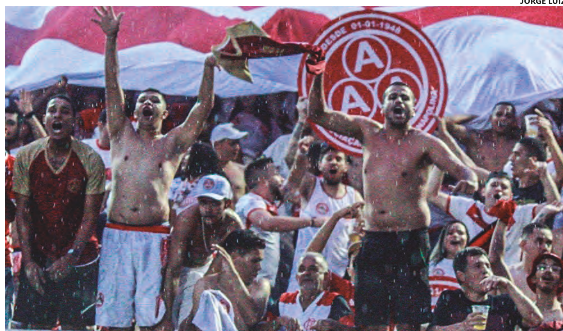
Média é de 2.081 torcedores a cada partida disputada pela Rubra em casa na Divisão de Acesso de 2023

Neste ano, os colorados ainda poderão acompanhar mais dois confrontos no Jonas Duarte. O primeiro deles será já nesta quarta-feira (4), às 19h30, contra o Aparecida. Depois, a Xata sai para encarar Goiatuba e Jaraguá e fecha a participação no estadual em casa, no dia 22 de outubro, contra o Santa Helena.