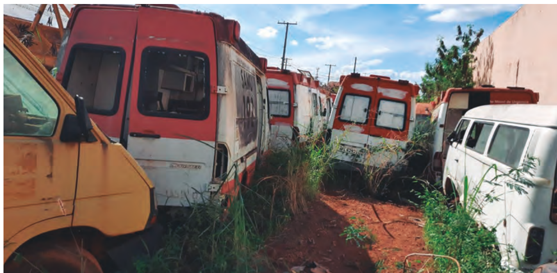
São várias motocicletas, veículos automotores leves e pesados, classificados como irrecuperáveis e sucatas

Os bens serão vendidos em caráter "AD CORPUS", no estado de conservação em condição em que se encontram, não cabendo, pois, ao leiloeiro, nem à Prefeitura Municipal de Anápolis, qualquer responsabilidade posterior, pressupondo-se terem sido previamente examinados os bens, bem como conhecidos e aceito os termos do certame pelo licitante.