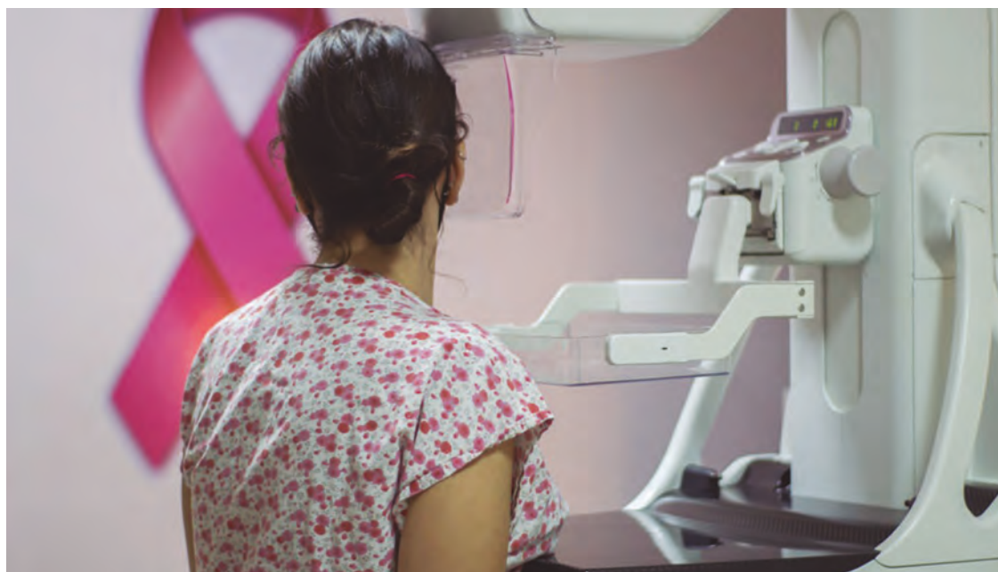
Segundo Secretaria Municipal da Saúde (Semusa), em média 720 mulheres são atendidas por mês na cidade

Em contrapartida, os primeiros meses do ano, janeiro e fevereiro, foram os que obtiveram o menor número de procura,